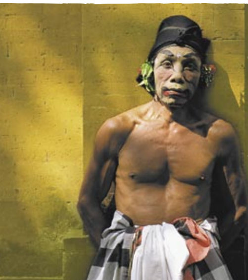
Danseur de barong au repos