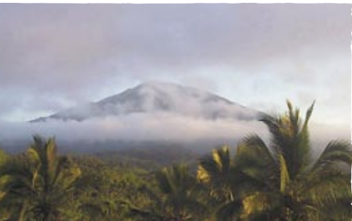
Le mont Batukura