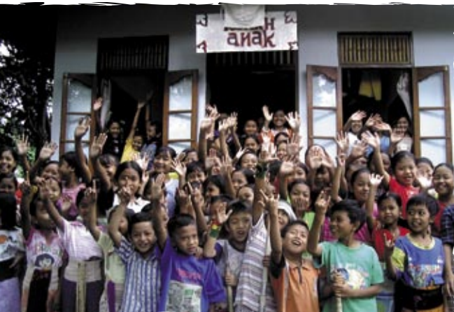
Enfants de la Fondation Métropoli